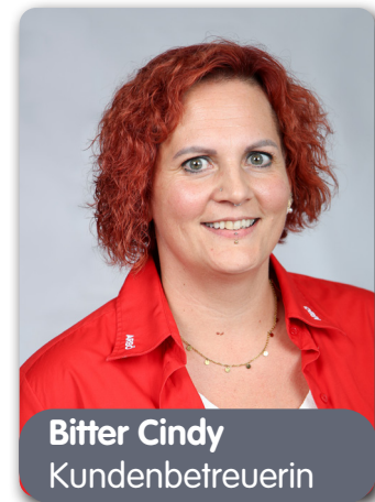
Bitter Cindy Kundenbetreuerin